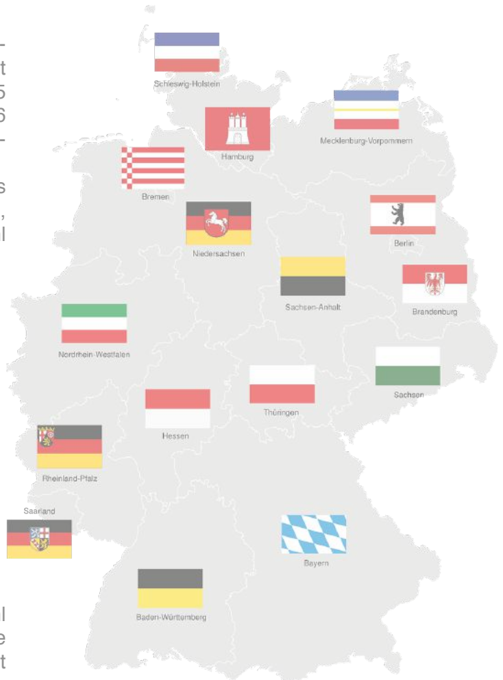
■ Bundesländer nach Gewichtung im Dax

Jedoch muss sich alleine von der Anzahl der Unternehmen, welche im Dax vertreten sind, NRW nicht hinter den südlichen Bundesländern verstecken, denn es liegt mit Bayern gleich auf - zumindest, wenn es um die Anzahl der DAX-Konzerne geht. Aber auch was die prozentuale Gewichtung im Dax angeht, liegt NRW weit vorne.