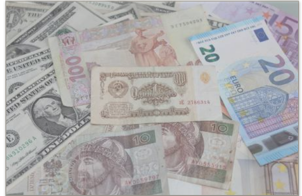
■ Durchschnittlicher Umsatz pro Handelstag in Forex weltweit 1995 bis 2016

Die Grafik zeigt die Entwicklung des durchschnittlichen Umsatzes pro Handelstag am weltweiten Devisenmarkt von 1995 bis 2016 in Milliarden US-Dollar. Dieser lag 2016 bei über 5.000.000.000.000 oder 5 Billionen US-Dollar. Das entspricht ungefähr dem 14-fachen der jährlichen Wirtschaftsleistung Österreichs.