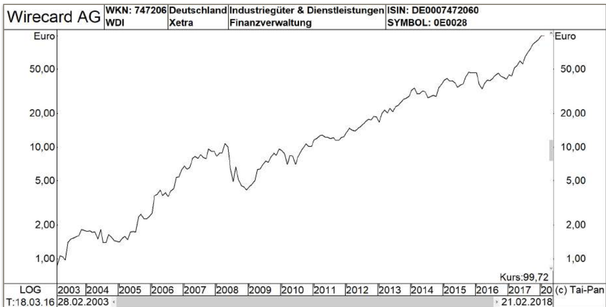
Langfristchart der Wirecard AG — Xetra.

Ergänzt wird das Angebot dadurch, dass die Wirecard AG Zahlungsdienste, wie zum Beispiel Karten oder auch elektronische Zahlungsdienste, anbieten kann und hierfür auch die notwendige Infrastruktur liefert.