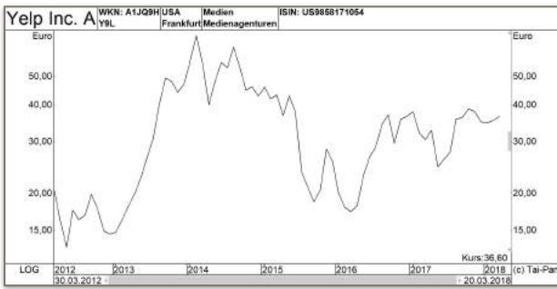
Langfristchart der Yelp Inc. — NYSE.

ansässiger Online-Händler für Schuhe und Mode.